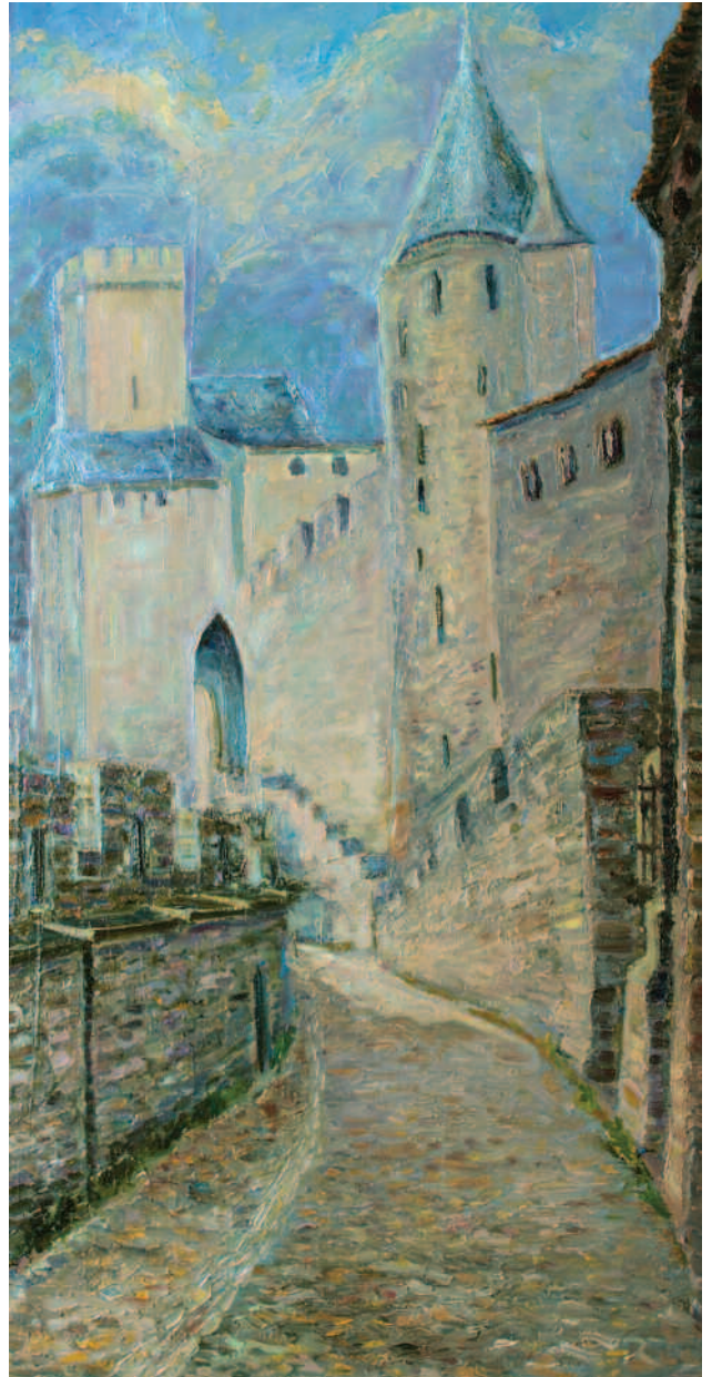
Воронов С. "Каркассон" х., м., 50х100, 2010 S.Voronov "Carcassonne" oil on canvas, 50x100, 2010

Time is getting on and the nature of the artist is waking up and dominates in the life of author. Stanislav seriously takes in hands the paints and doesn't leave them anymore. He is a participant of many exhibitions in Russia and abroad. His paintings belong to the private and corporate collections of Russia, Belarus, Ukraine, France and other countries.