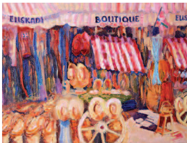
Воронов С. "Испанский бутик" х., м., 40x30, 2010 S.Voronov "Spanish boutique" oil on canvas, 40x30, 2010

Stanislav was born in a small village in a family of teachers - rural Intellectuals. He studied perfectly, because of the status of parents not allowed to be worse. Since early years he painted a lot and wanted to be a painter. But circumstances have turned differently and he became the lawyer.