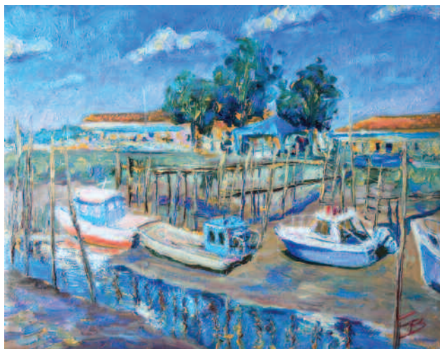
Воронов С. "На устричной ферме" х., м., 40x30, 2010 S.Voronov "On oyster farm" oil on canvas, 40x30, 2010

Станислав родился в деревне, в семье сельских интеллигентов - учителей. Учился отлично, т.к. статус родителей не позволял быть ниже. С ранних лет хорошо и много рисовал и хотел быть художником. Но обстоятельства повернулись иначе, и он стал юристом.