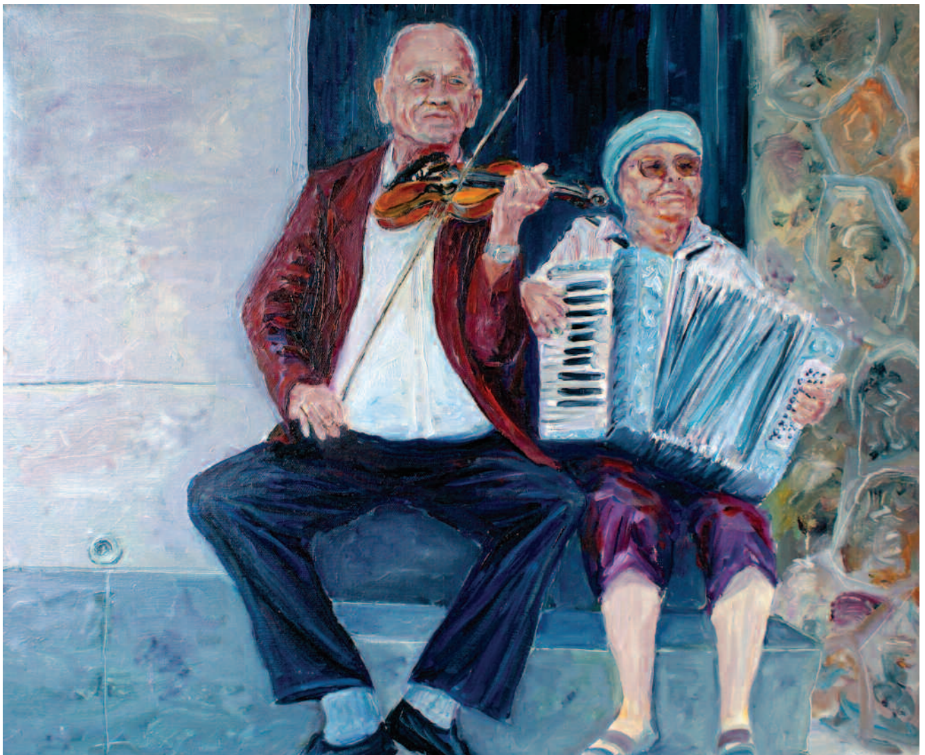
Воронов С. "На улице Парижа" х. м., 60x50, 2009 S.Voronov "In Paris street" oil on canvas, 60x50, 2009

Landscapes and still-lives of Stanislav Voronov, which have appeared at exhibitions in the beginning of 2000th years, at once have drawn to themselves attention by their freshness and emotionality. Live breath of the nature proceeds from his artworks. It seems this world was repeatedly seen and praised in painting of many artists, but on his canvases it excites and grasps us again and again. Partial to beauty of world around, the artist absorbedly draws and writes a lot. Traveling much, Stanislav brings the remarkable traveling drawings which are artistic performed by.